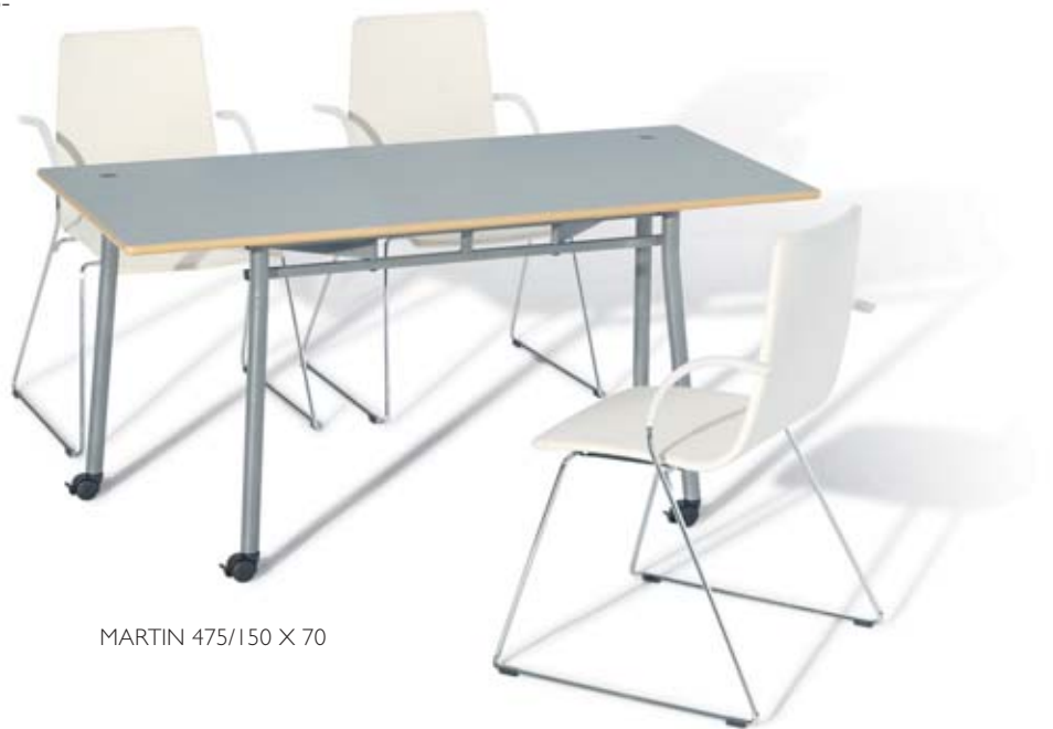
MARTIN 475/150 X 70

When folded, the self-standing Martin table requires little space. It is set up simply by folding out its legs, no tools are needed. A clamp secures the locking. Castors allow the table to be moved around easily. Martin tables are stable thanks to their lockable castors and the locking clamps of their legs. The desired size and shape can be attained by linking the tables together either sideways or end-to-end.