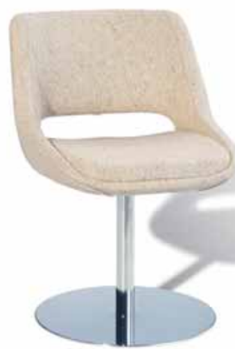
MINI KILTA 221C