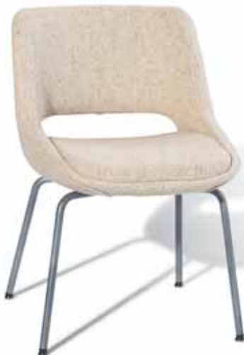
MINI KILTA 221A

Der Stuhl ist in zwei Varianten erhältlich: Kilta mit Armlehnen und Mini Kilta ohne Armlehnen. Beide Stühle gibt es mit zwei verschiedenen Gestellen: Tellerfuß und Vierbein-Gestell. Für die stilvoll rundumbezogenen Stühle gibt es eine vielfältige Farb- und Material-Auswahl.